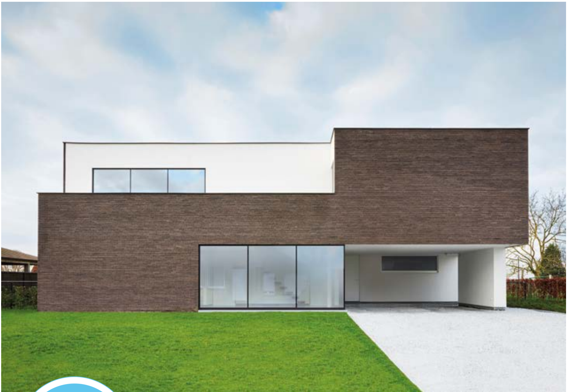
ontwerp: Architectuuratelier De Jaeghere

Heb je ook (ver)bouwplannen? Vertrouw op Durama! CONTACTEER ONS!